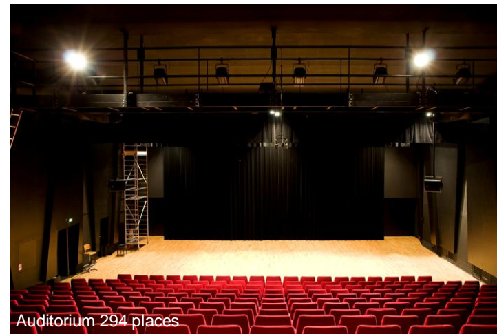
Auditorium 294 places