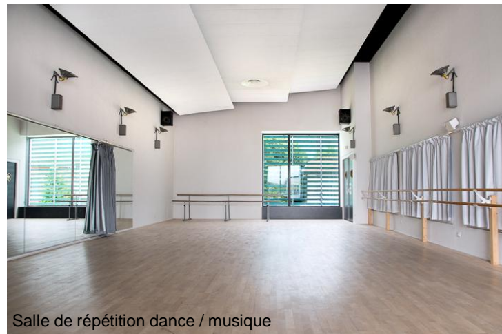
Salle de répétition dance / musique